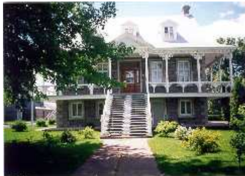
Presbytère de Saint-Cuthbert, l'un de deux seuls monuments historiques de la MRC reconnue par le ministère de la culture

Avec le temps, la population s'est multipliée, et une institution religieuse et scolaire devint nécessaire. En 1767, une petite chapelle en bois est construite, suivi plus tard par l'édification d'une église en pierre en 1779. Un siècle plus tard, un presbytère (1876) et une école (aux environs des années 1880) sont construits. Ce presbytère est classé monument historique en 1978 par le ministère de la culture