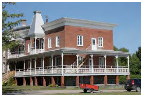
La résidence Sainte-Anne au 1980, rue Principale. IMG_8469.jpg