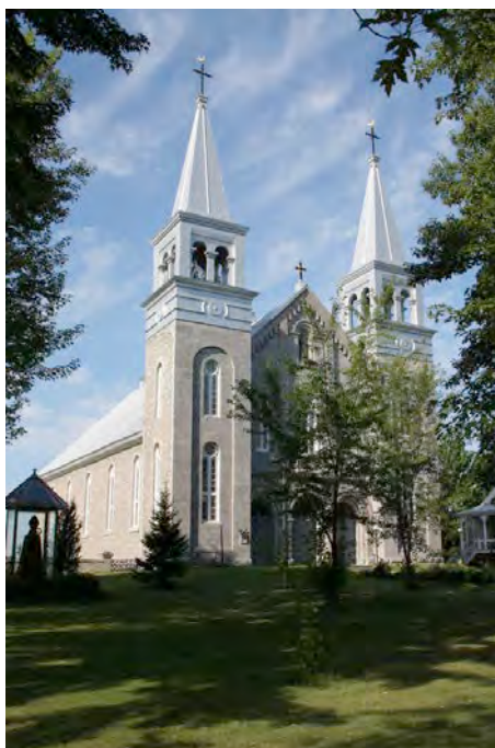
L'église de Saint-Cuthbert au 1989, rue Principale. IMG_8259.jpg

Localisé au cœur de la municipalité, l'ensemble institutionnel de Saint-Cuthbert est formé de l'église et du presbytère, ainsi que de l'ancien collège du Sacré-Cœur, de l'ancien couvent de Saint-Cuthbert et de la résidence Sainte-Anne. Cet ensemble institutionnel domine le paysage architectural de Saint-Cuthbert et les édifices qui le constituent possèdent une valeur patrimoniale supérieure ou exceptionnelle.