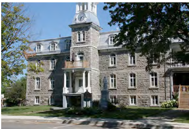
L'ancien couvent de Saint-Cuthbert au 1980, rue Principale. IMG_8457.jpg

Les deux édifices à valeur patrimoniale exceptionnelle se démarquent notamment par leur valeur d'histoire et leur valeur d'art et d'architecture. Ils représentent un héritage important pour la municipalité de Saint-Cuthbert.