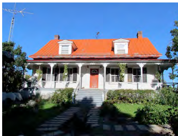
Le 1171, rang du Nord-de-la-Rivière-du-Chicot. IMG_3697.jpg

Les édifices à valeur patrimoniale supérieure, au nombre de 19, correspondent aux plus vieux bâtiments de la municipalité (antérieurs à 1850), mais dont l'état d'authenticité a été légèrement altéré. Leur valeur d'authenticité est surtout excellente ou supérieure. Ces édifices offrent pour la plupart une valeur d'art et d'architecture.