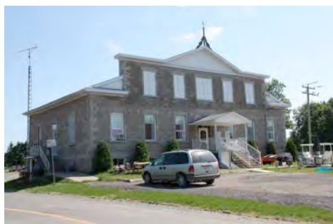
L'ancien collège du Sacré-Cœur au 1960, rue Principale. IMG_8491.jpg