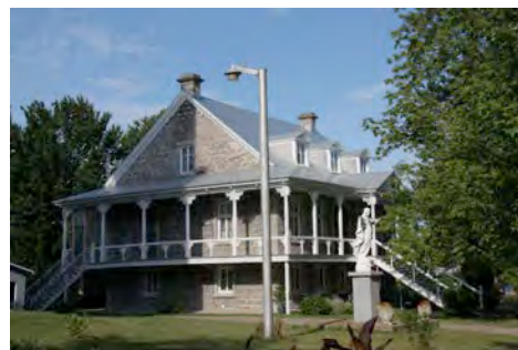
Le presbytère de Saint-Cuthbert au 1991, rue Principale. IMG_8279.jpg