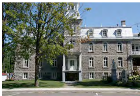
L'ancien couvent de Saint-Cuthbert au 1980, rue Principale. IMG_8456.jpg