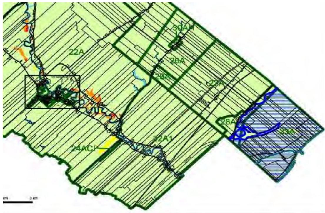
NOUVELLE ZONE 22A1